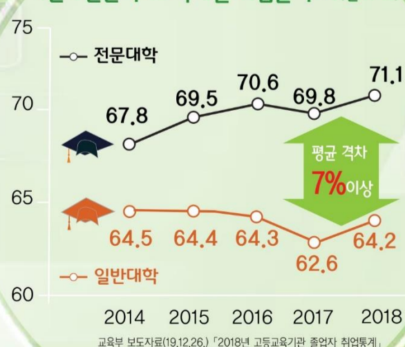
지난 5년간 주요 학제별 취업률 추이(단위 %)